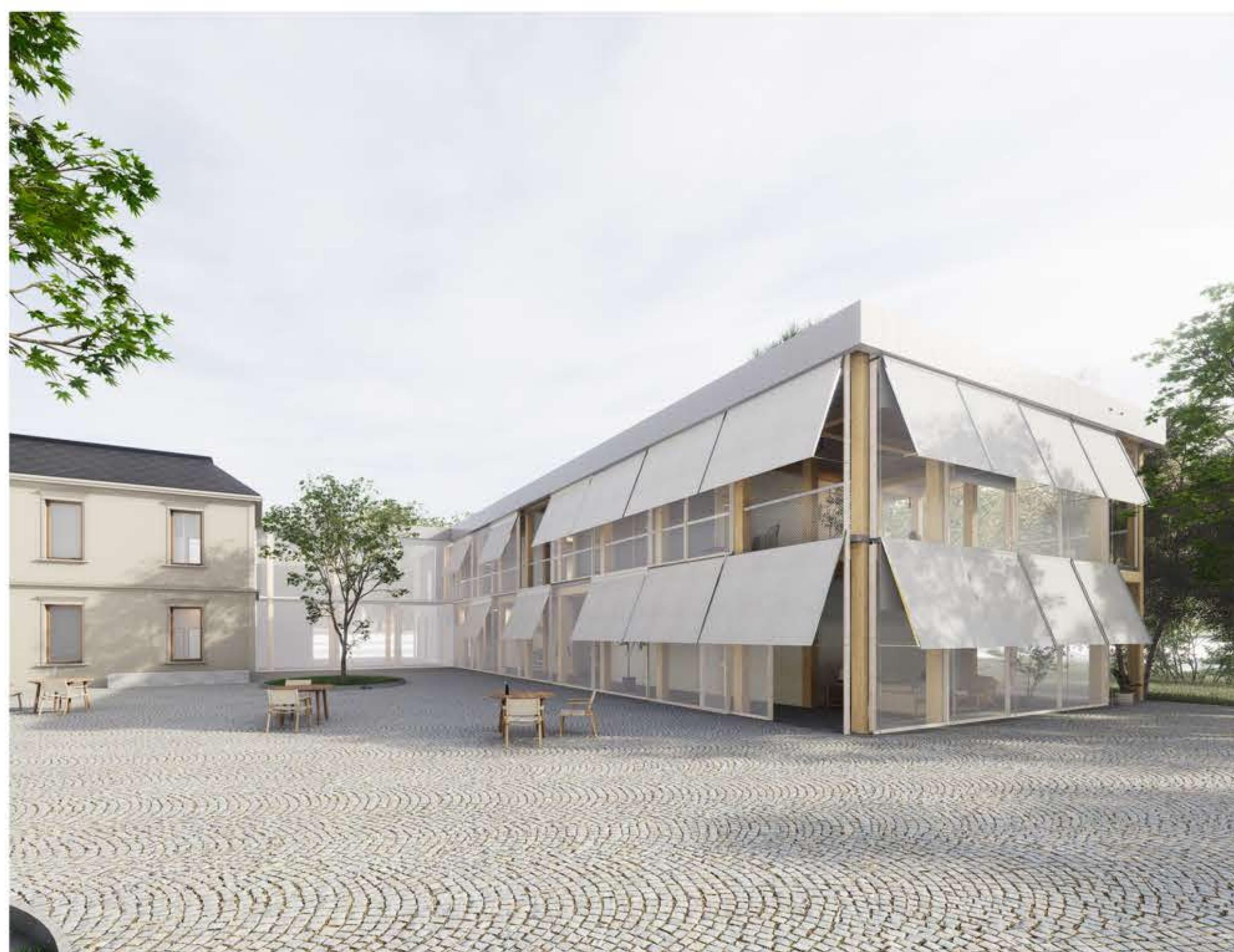
POHLED NA DŮM DO DVORU (SPUŠTĚNÉ MARKÝZY)