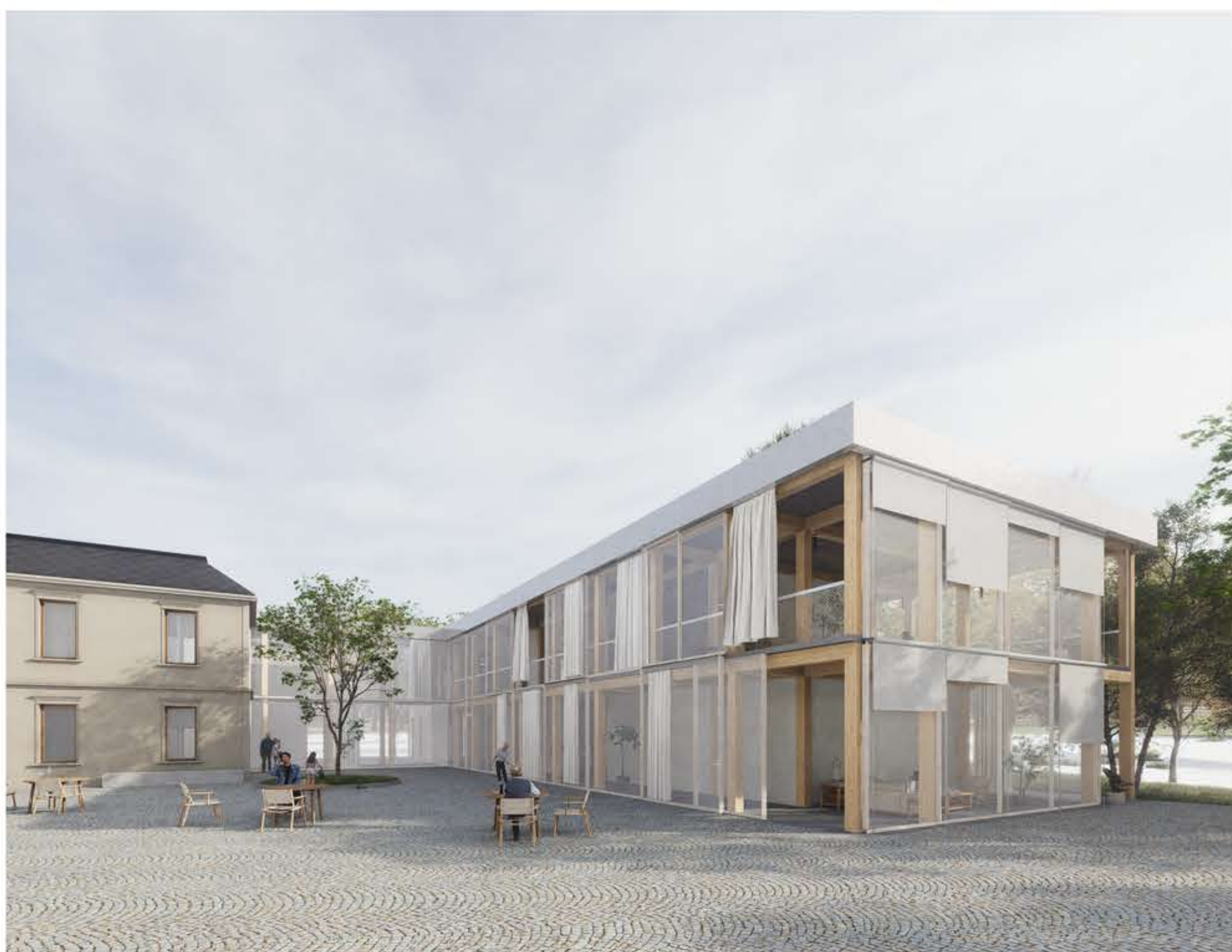
POHLED NA DŮM DO DVORU