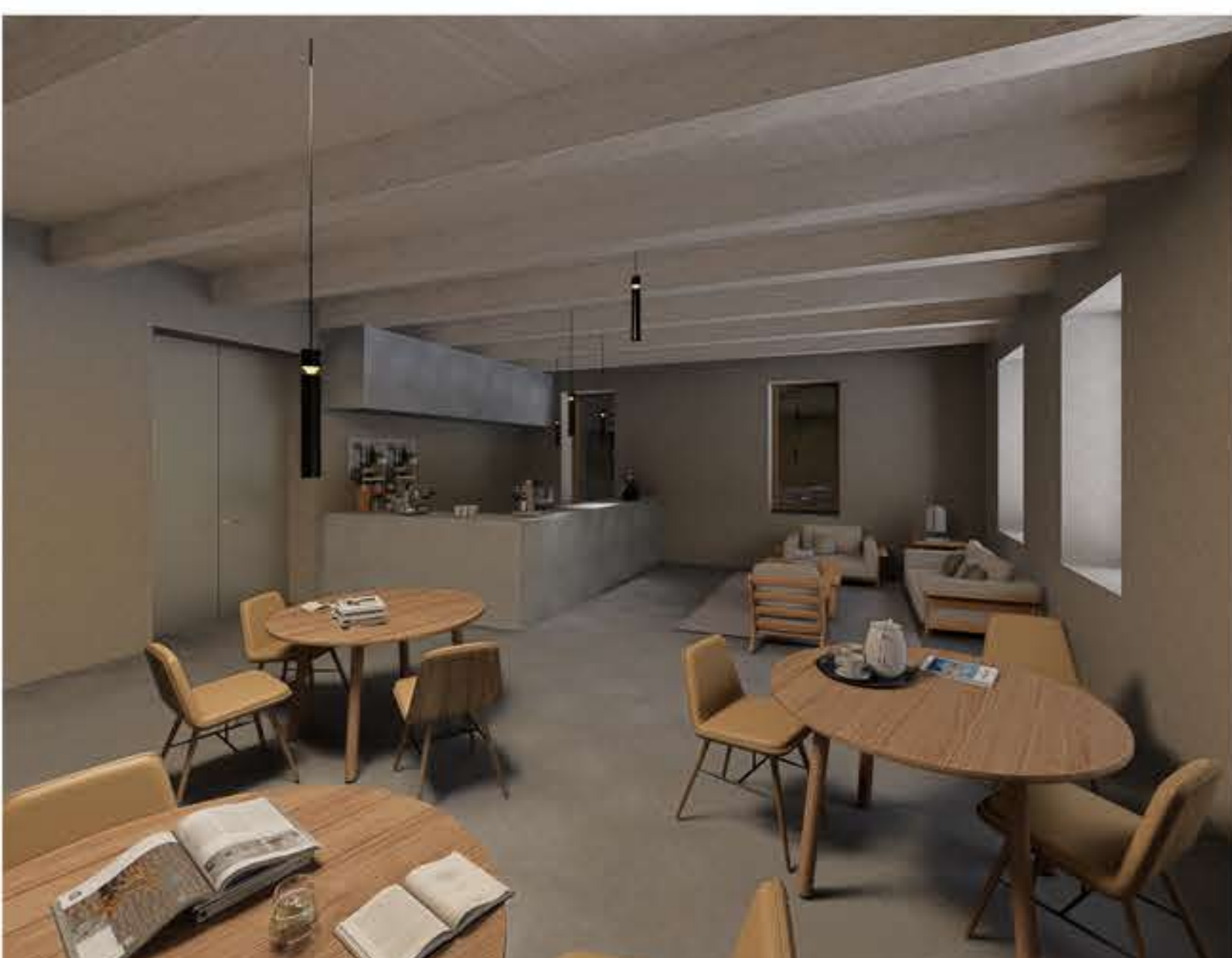
INTERIÉR STARÉHO DOMU