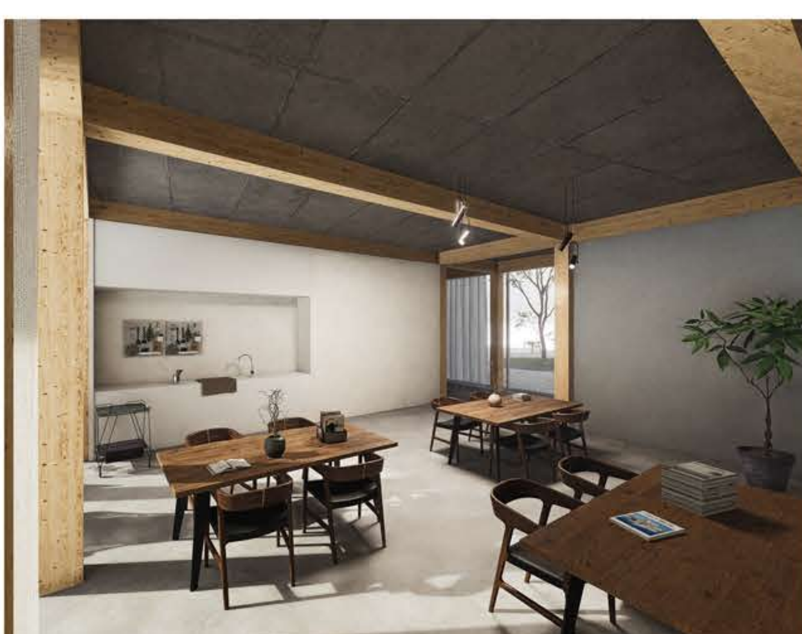
INTERIÉR NOVÉHO DOMU