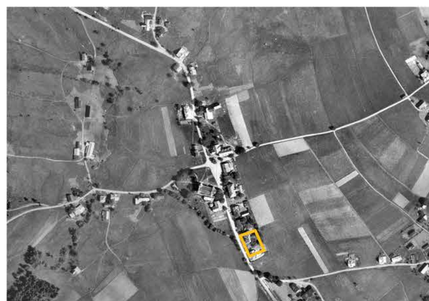
UMÍSTĚNÍ OBJEKTU V OBCI

Řešený objekt se nachází v centru Deštného v Orlických horách. Záměrem projektu bylo přeřešení prostorových vztahů, rekultivace veřejného prostoru, odhalení potenciálu historické budovy a její přístavba. Hub jako dějová linie vychází z předchozích funkcí původní budovy – přádelny, školy a muzea. Stará budova je očištěna od necitlivých přístaveb z minulých let. Přístavba ji symbolicky resuscituje – navrácí jí život a otevírá nové možnosti dalšího fungování. Nejde o kopii, ale o přístup založený na metaforách a materiálním výrazu. Klasické spojení materiálů – dřevo, kov, kámen (beton) – spolu s otevřeností stavby umožňuje budově souznít s krajinou. Přístavba se tak stává rovnocenným partnerem v dialogu mezi starým a novým.