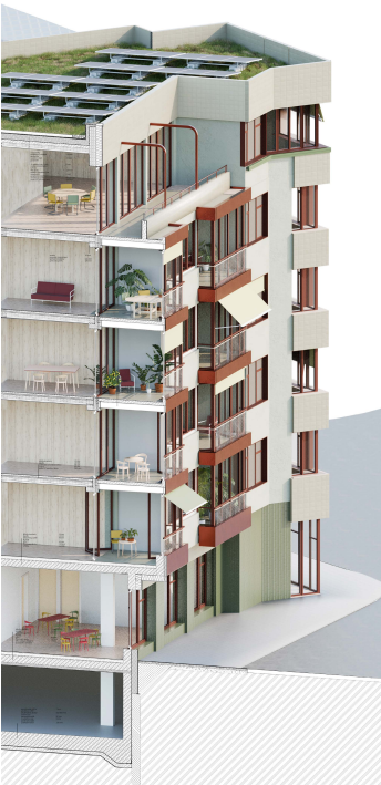
řezopohledová axonometrie, detail